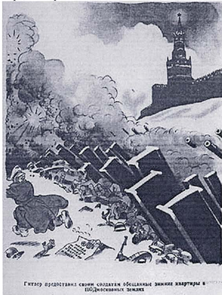
Гитлер предоставил своим солдатам общаковые зимние квартиры в Подмосквовых землях

8. Рассмотрите изображение и выполните задание.