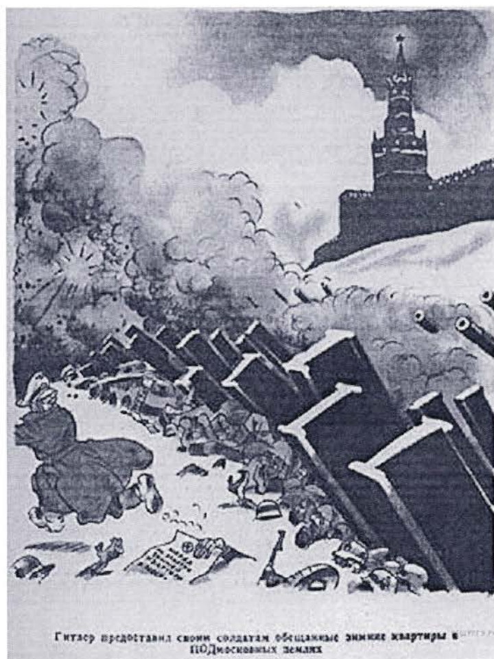
Гитлер предоставил своим солдатам обшаренные зимние квартиры в Подмосквовых землях

8. Рассмотрите изображение и выполните задание.